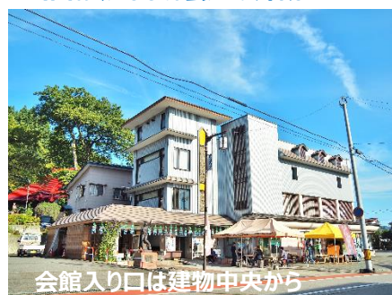
会館入り口は建物中央から