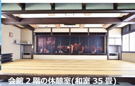
会館 2 階の休憩室(和室 35 畳)